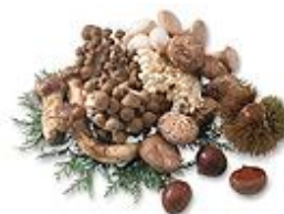
原材料の野菜類（イメージ）