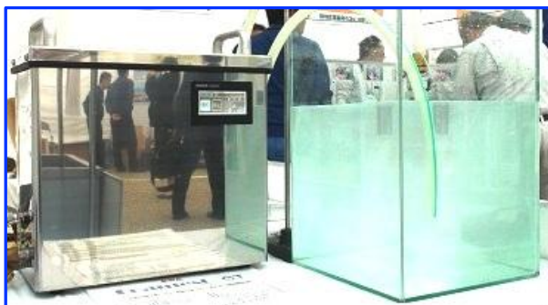
Foamest CT のマイクロ・ナノバブル発生状況 (岐阜テクノフェア2011 ナック販売 ブース展示)

Foamest CTから発生する平均10 \mu のマイクロ・ナノバブルが、洗浄槽内のワーク（部品）の微細な孔、複雑な隙間まで浸透します。マイクロ・ナノバブルは、マイナス電荷を帯びておりますので、不要な油分・ゴミなどに付着し、浮力により洗浄槽の上面に浮上致しますので洗浄の効果が高まります。